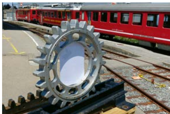
Blickfang auf dem Bahnhofareal in Heiden ist ein grosses Zahnrad, das zum Besuch der Ausstellung «150 Jahre Rorschach-Heiden-Bergbahn» einlädt.

Passagiere wurden verletzt. Interessant wiederum ist die 1913 projektierte Verlängerung der Bahn nach Wolfhalden, wobei das Vorhaben wegen des 1914 ausbrechenden Ersten Weltkriegs unverwirklicht blieb. Die bis Oktober dauernde Ausstellung ist bei freiem Eintritt täglich zugänglich.